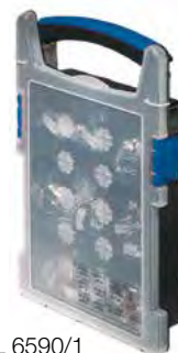
L 6590/1 W1