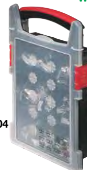
W4 INOX AISI 304

Composto da 60 fascette L 6574/1 interamente in acciaio inossidabile - W4